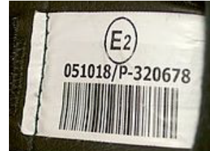
ECE 22.05 (ενδεικτική ετικέττα)

Τα αποδεκτά ανά περίπτωση κράνη ECE 22.05 είναι τα ακόλουθα: