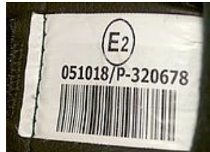
ECE 22.05 (ενδεικτική ετικέττα)

Τα αποδεκτά ανά περίπτωση κράνη ECE 22.05 είναι τα ακόλουθα: